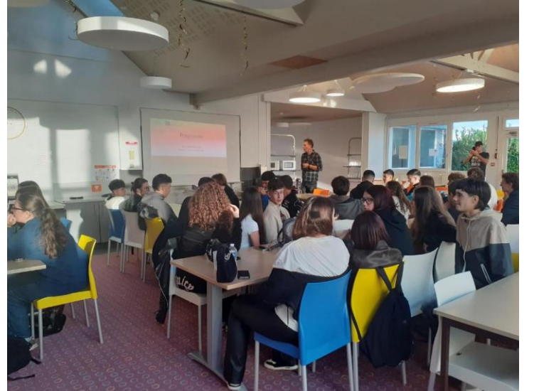
Elevii au participat la ore de matematică, limba engleză, artă, muzică, istorie, biologie, chimie, TIC, geografie.